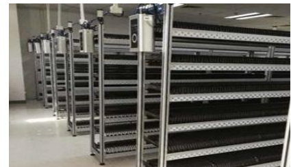
Kombination von Einzelregalen