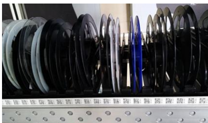
Codes zur manuellen Programmierung